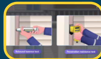
Non-destructive Tests for Concrete Strength